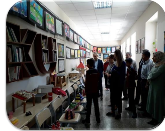
Geleneksel Yıl Sonu Teknoloji Tasarım ve Resim Sergisi