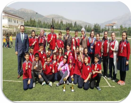
Geleneksel Çocuk Oyunları Şenliğinden Ödüllerle Döndük.