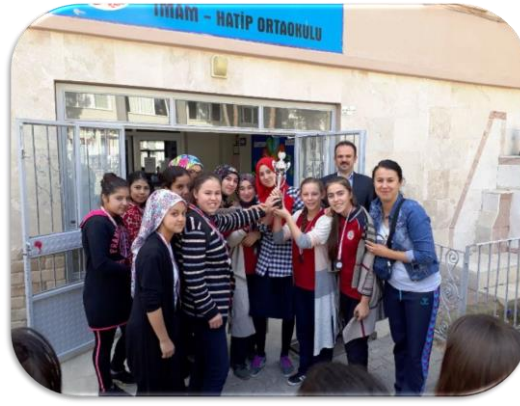
Yıldız Kızlar Voleybol Takımımız Bölge Üçüncülüğü Kupasını Aldılar.