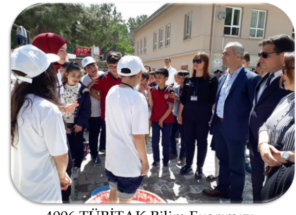
4006 TÜBİTAK Bilim Fuarımızı Gerçekleştirdik.